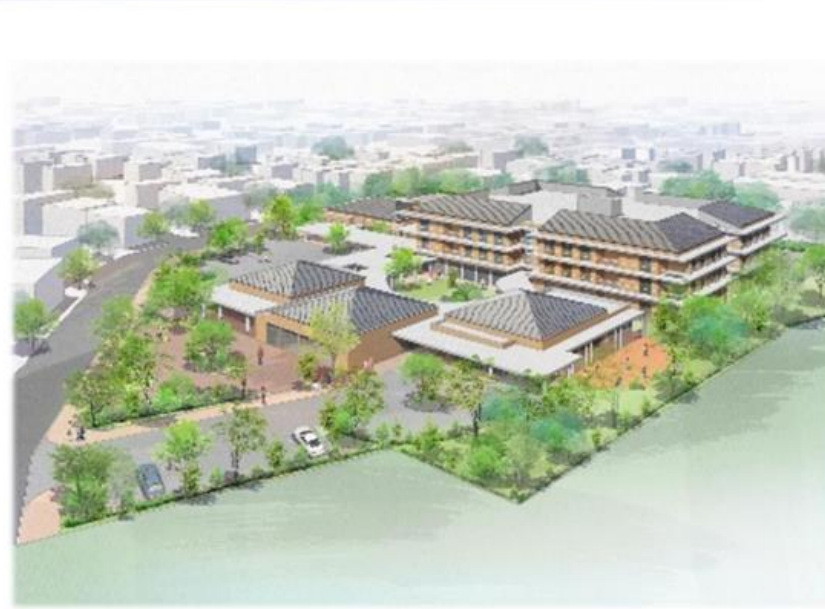
福岡市城南区茶山所在の公務員宿舎跡地

○これまでに3市5件の定期借地契約が決定。国有地を活用して介護施設を整備することで、介護と仕事を両立できる「安心につながる社会保障」の一助となっています。