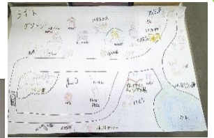
ライトグリーンチーム

3月11日と3月21日の2日間、市内の小学生8名が、ボランティア「ワベル」のお兄さんお姉さんと一緒に、米多比ルートと薬王寺ルートの2班に分かれ探検をして、たくさんの“良い”を見つけました。あいにくの雨でしたが、バスに乗ったり、歩いて目的地を自指しながら、地元の良さを知ることができました。最後はみんなで協力して、世界に一つだけの手書き地図を作りました。