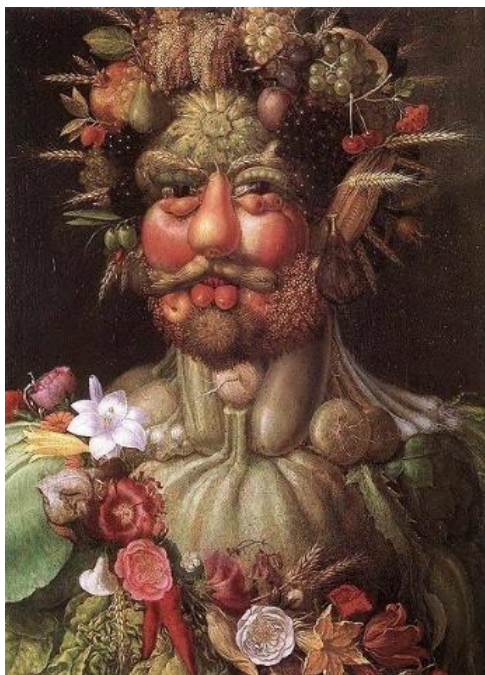
ジュゼッペ・アルチンボルドの油彩画 「ウエルトウムヌスとしての皇帝ルドルフ2世像」

寄せ絵とは、ひとやどうぶつ、やさいなどの絵を寄せ集めて描かれた絵だよ。 下の絵をよく見えてみて！ 人の顔のように見えるね！ なんだかジグソーパズルみたいだね！