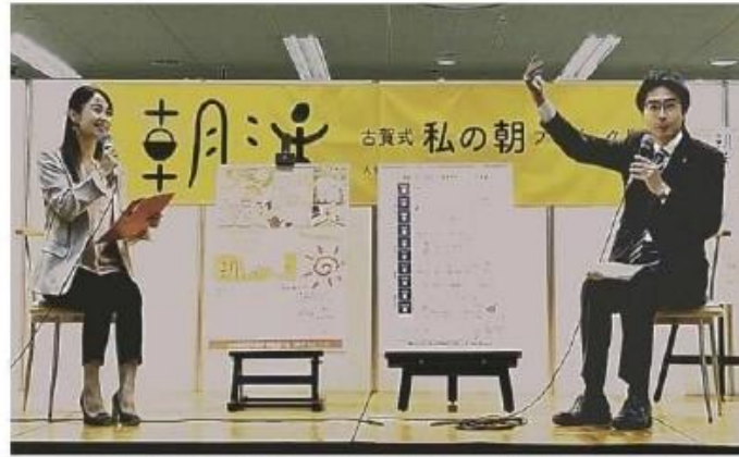
古賀市で開かれたイベントで、朝食の重要性を強調する田辺市長（右）