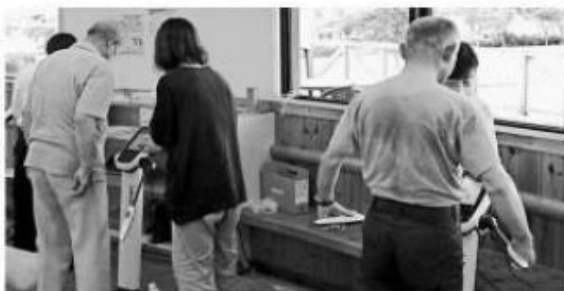
古賀市民らが参加したインボディ体験会

参加者には、明治から乳たんぱく質を手軽に摂取できるブランド「タンパクト」製品が無料配布された。