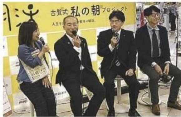
イベントで話す古賀市の田辺市長（右から2人目）と福津市の原崎市長（同3人目）

同プロジェクトは、朝食習慣や朝の時間を有効活用する「朝活」を普及して住民の健康増進につなげるのが目的。古賀市の田辺一城市長が「広域的な取り組みに発展させよう」と呼びかけ、福津市の原崎智仁市長が応じた。